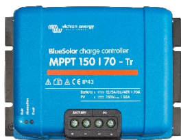
Contrôleur de charge solaire MPPT 150/70-Tr