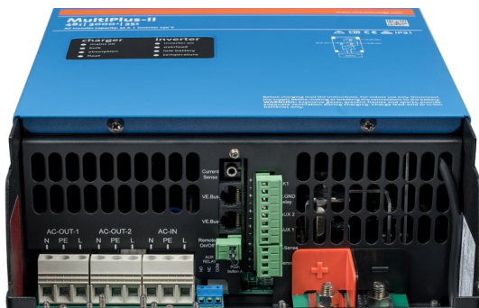
Zone de connexion

Permet de mesurer la tension de batterie et la température et de superviser et contrôler le système avec un Smartphone ou tout autre dispositif équipé de Bluetooth.